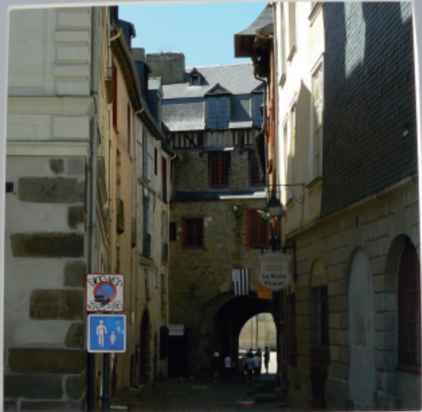
Le coude de la rue cache la porte mordelaise, menant à la place des Lices

La porte mordelaise (ou portes mordelaises ) est un châtelet d'entrée, vestige des remparts de Rennes . Son emplacement date du III e siècle, à la création des premiers remparts, mais son architecture date